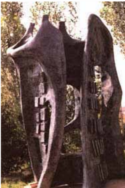
Évolution - 1995

Exposée à la Bibliothèque Étienne-Parent à Beauport