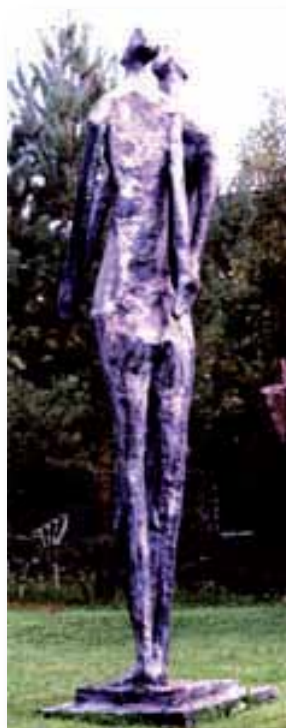
Pas de danse - 1988

Acier, bois et résine (355 x 71 x 76 cm)