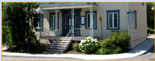
Vue des Jardins des bureaux de l'Arrondissement de Beauport.